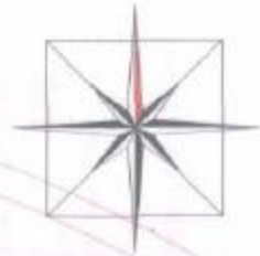
SCHÉMA ZÁVAZNÝCH ČASTÍ RIEŠENIA A VEREJNOPROSPEŠNÝCH STAVIEB ZMENY A DOPLNKY 2016