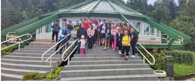
Exkurzia v jaskyni

organizujeme školenia pre našich učiteľov a nástroje o nových metódach a prístupoch. Zároveň však dbáme na to, aby sme nezabudli na tradičné hodnoty a kvalitu vzdelania, ktoré naše gymnázium vždy reprezentovalo. Myslíme si, že kombinácia tradičných a nových prístupov je kľúčom k úspechu.