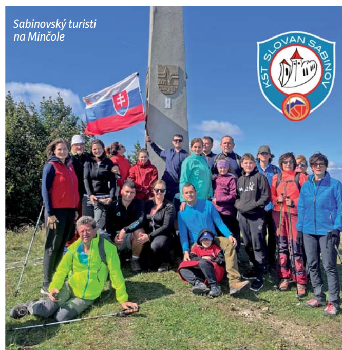
Sabinovskí turisti na Minčole