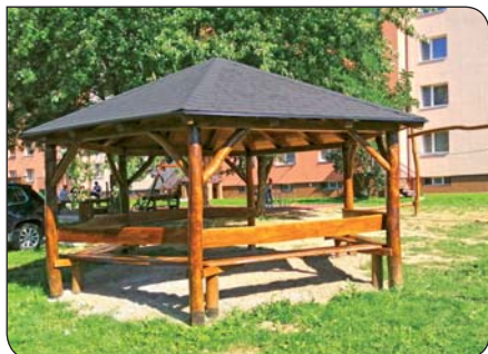
4 | Darček mesta pre deti V meste pribudlo detské ihrisko - Rodinka