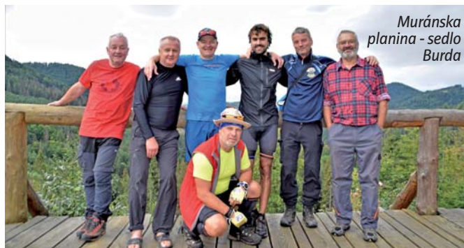
Muránska planina - sedlo Burda

Ďalšou časťou prechodov slovenských pohorí bolo pohorie, ktoré nie je veľmi atraktívne, ale krásne rozsiahle lúky a lesy určite stoja za svoju pozornosť. A už vôbec to nebola ľahká a pohodová turistika, ako sa na prvý pohľad pozdáva. Trasa: Petkovce – Bučky – Kvakovce (Domaša dobrá) – Grófňa – Valkov – Zlámaniská – Medzilazy – Kručov – Lomné – Kručov – Kamenec – Vyšná Olšava – Šandal – Radoma – Baňa – Banské – Rakovčik – Rajsová hora – Ostrý vrch – Čierna hora – Makovica – Lazová lúka – Kurimka. Dĺžka trasy: 70,60 km. Stúpanie: 2 321 m. Klesanie: 2 369 m.