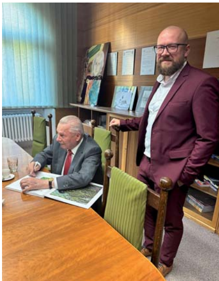
Prezident Schuster pri návšteve Mestského úradu v Sabinove venuje svoju knihu mestu.